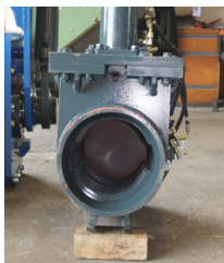
Für Holzpfähle Poteaux en bois Ø 160-220mm