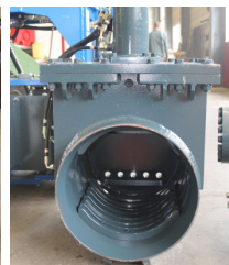
Für Holzpfähle Poteaux en bois Ø 220-370mm