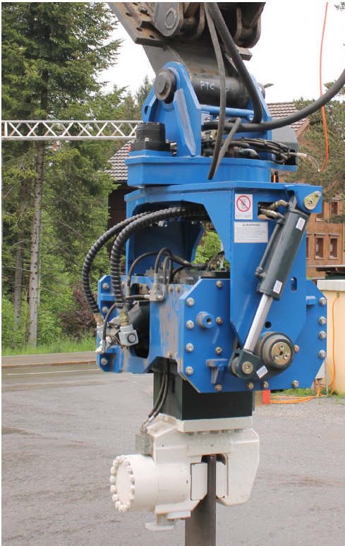
Klemmzange Pince standard

Innenbreite H-Träger >180mm Largeur intérieure profil H >180mm